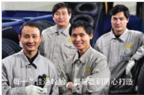
每一条佳通轮胎，都是我们用心打造

佳通轮胎一直致力于保持最高标准的 质量控制体系 ，五大生产基地均获得ISO/TS16949:2002 质量管理体系认证 及ISO14001环境管理体系认证。