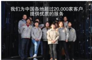
我们为全国各地超过20,000家客户提供优质的服务

佳通轮胎拥有中国最大的 营销网络 ，超过20,000个 销售终端 。2010年，在此基础上，佳通成功启动全新的佳通零售体系，打造更专业的 零售网络 。仅在一年內就有3,500家门店加入这一体系，并因此大大提高业绩。